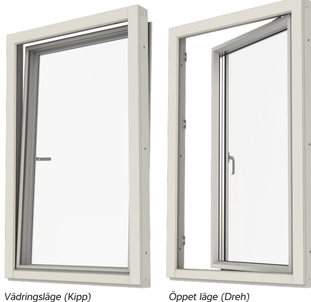
Öppningssätt – vädrläge respektive sidhängt